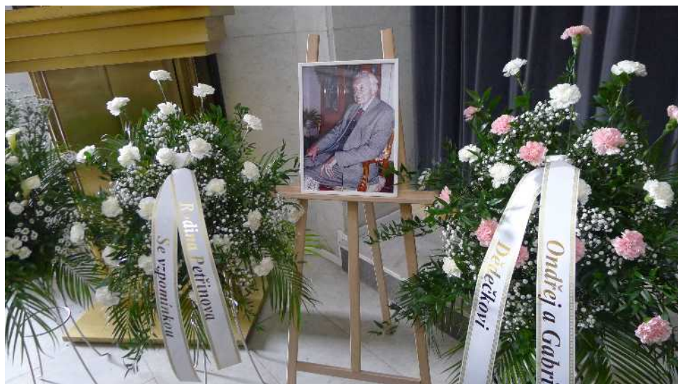
Text J. Mašek