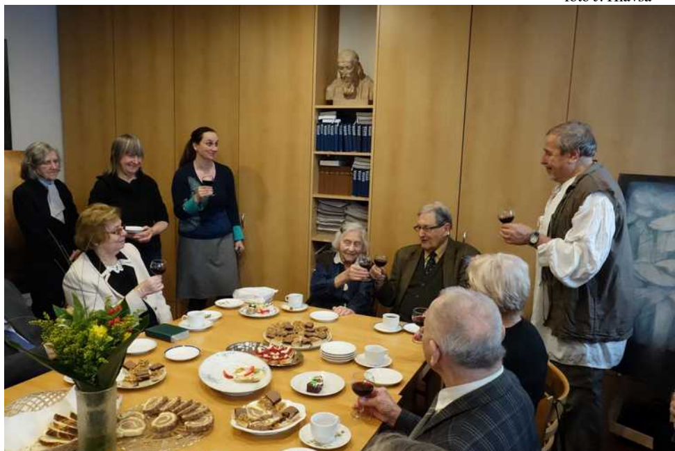
Oslava narozenin sestry Adamové