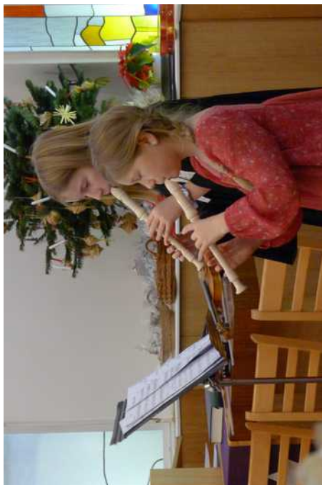
listopad 2019: Děti při bohoslužbách prosinec 2019: Naši pěvci při advent. Bohoslužbách prosinec 2019: Vánoční slavnost dětí