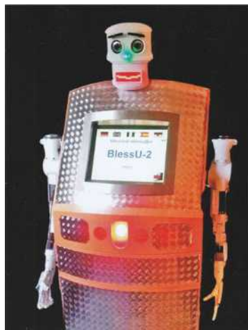
Weltausstellung 2017 in Wittenberg World Exhibition 2017 in Wittenberg

A už vůbec jsem nemohl přeskočit „žehnajícího robota“. Stal se velkou atrakcí této výstavy, na kterou se stály i fronty. Byl instalován poblíž kaple a bohoslužebného zákoutí, kde se každý mohl zameditovat o úloze člověka na cestě víry i možnostech a nebezpečí techniky. Robot nabízel výběr několika druhů požehnání, mohl mluvit ženským i mužským hlasem, v několika jazycích a pak vám ještě vámi zvolené požehnání vytiskl. Zvláštní pocit stát proti mrkajícímu „železu“, které umí i aronské požehnání, a ještě k tomu zvedne obě ruce. Provokativní, zajímavý nápad, který dá každému prožít, že zkrátka v něčem „člověka nenahradíš“.