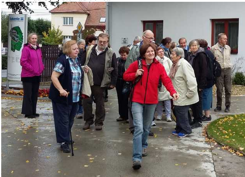
Vedoucí jde vždy jako první!

Výlet na Říp z Krabčic je asi na 2 hodiny, a téměř všichni účastníci se tam vydali. Obdivuhodné, že téměř všichni na vrchol i vyšli, ač věkový průměr účastníků zájezdu byl jistě nad 70 let.