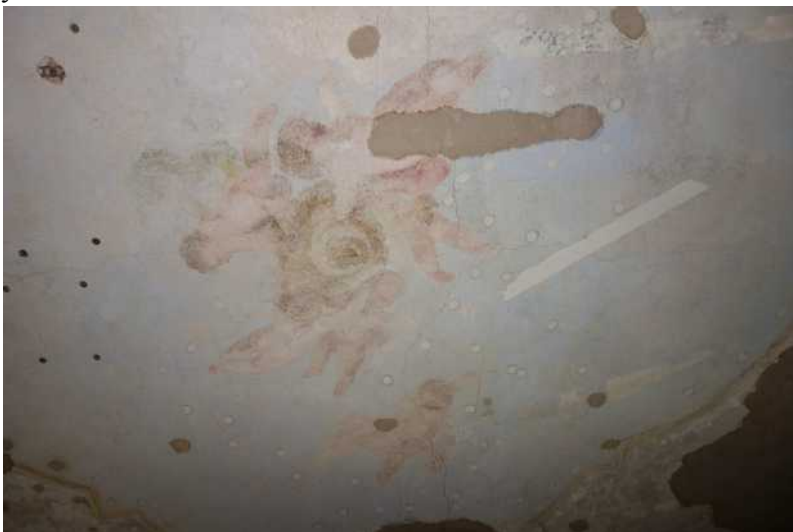
Cenné zbytky původní výmalby prosvítají na stropě

v jakém byl v 19. století. Je možné, že pod vrstvami omítky zůstala zachována dekorativní výmalba či nápisy biblických veršů, kterými jsou tradičně zdobeny interiéry tolerančních modliteben.