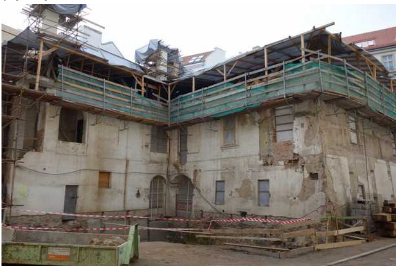
Pohled ze dvora – budoucí zelené oázy uprostřed města

Z médií jsme se dozvěděli, že Městská část Prahy 1 vyčlenila v rozpočtu na rok 2019 částku 45 mil. Kč na rekonstrukci historického objektu v Truhlářské ulici č. 8. Předpokládané celkové náklady mají být cca 70 mil. Kč. Projekt rekonstrukce byl zpracován v roce 2018 ateliérem KAVA. Plnohodnotné využití domu je navrženo ke zpřístupnění a využití všech prostor domu – tedy i sklepů a podkroví. Proto bude dispozice domu doplněna o novou venkovní věž se schodištěm a výtahem. To umožní bezbariérový přístup do všech podlaží a jejich využití pro větší počet osob i z hlediska požárních úniků. Obdobně jako jsou novodobé zásahy čitelné v exteriéru, bude také interiér doplněn o další drobné vestavby, jako jsou sociální a technická zařízení.