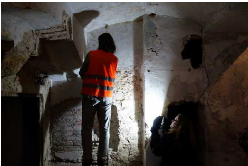
Památkáři při práci

byty pro duchovního a kostelníka. Od roku 1785 využíval modlitebnu i německý protestantský sbor, který v roce 1790 nebo 1791 přesídlil do kostela svatého Michala v Jirchářích.