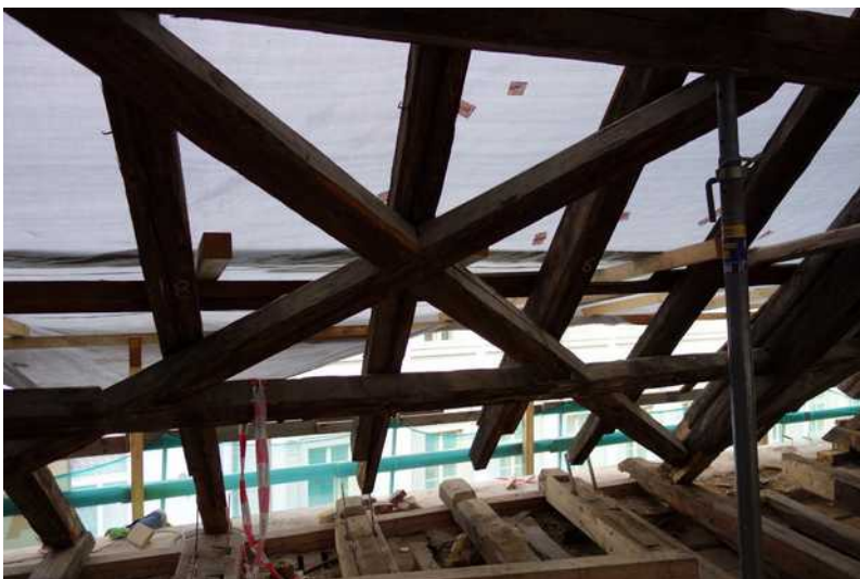
Staré trámy barokního krovu s ondřejskými kříži se propojí s novými

Všichni se můžeme těšit, že se alespoň částečně naplní usnesení synodu naší církve a bude zde zřízena stálá expozice dějin evangelíků v naší zemi.