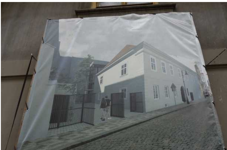
Vizualizace hotové stavby dokončené zhotovitelem, firmou AVERS roku 2020