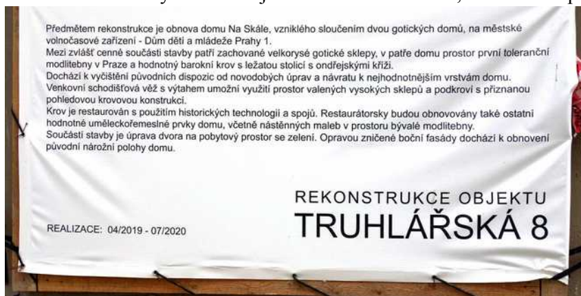
Přibito na fasádě