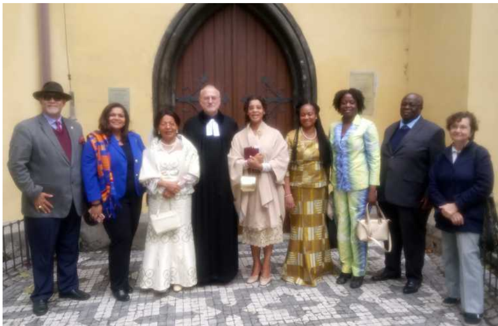
Chvilke po bohoslužbách při uvedení ghanské velvyslankyně do funkce