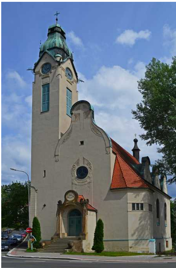
Secesní starokatolický kostel v Jablonci nad Nisou

Dějiny 20. století nebyly ke starokatolické církvi u nás zrovna laskavé. Ve 30. letech začala ostře narůstat národnostní nevraživost mezi Čechy a českými Němci, což se promítlo i do církve, která měla výraznou německou většinu. Válka přinesla velké materiální i personální ztráty, ale ta největší rána měla teprve přijít. Protože zhruba 95 % všech českých starokatolíků bylo německé národnosti, museli v roce 1945 v důsledku dekretů prezidenta republiky zemi opustit. Zůstaly po nich prázdné farnosti, které jen díky obratné politice biskupa Aloise Paška, který sám byl Čech, unikly zrušení. Sotva se církev nějak vzpamatovala z této rány, přišla rána druhá – komunistická totalita. Biskup Pašek v červnu 1946 zemřel a po roce 1948 už