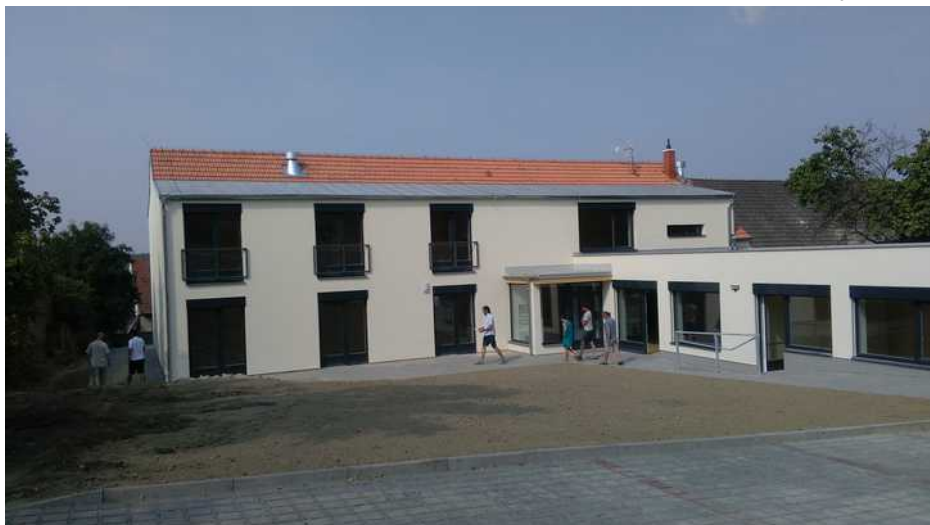
Chráněné bydlení v Nosislavi