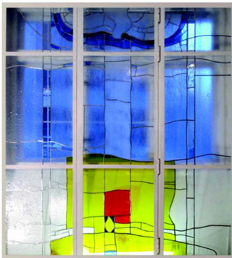
dejvické vitráže ovoce Ducha svatého: RADOST