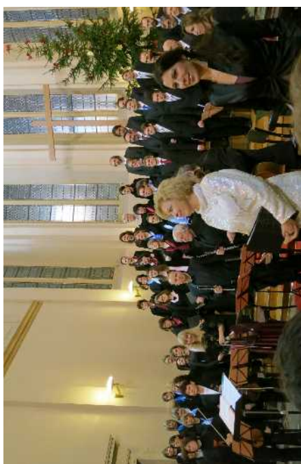
2013-12-13 Vánoční koncert NP u Salvátora