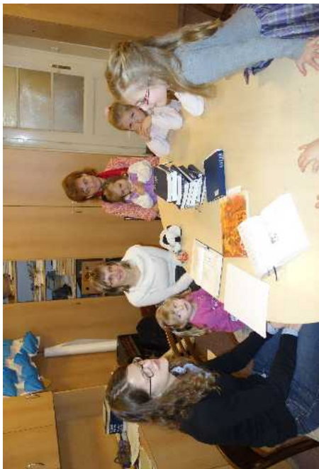
Výuka v NŠ