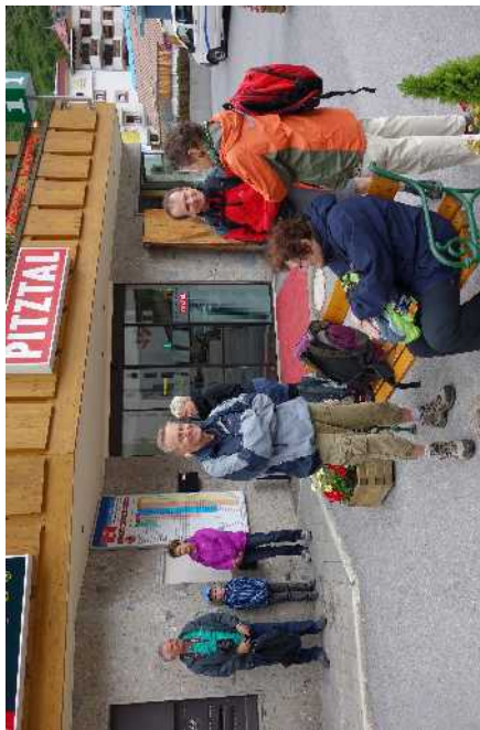
2013-06-30 Dovolená DS v údolí Pitztal