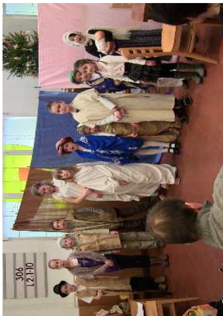
2013-12-22 Vánoční hra dětí