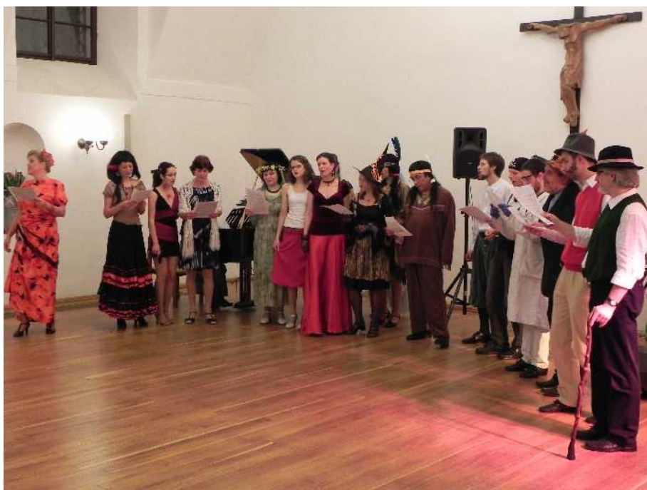
Plesání s bratry katolyky 11. 1. 2014, Pěvci & Co. a bratři Apači v akci