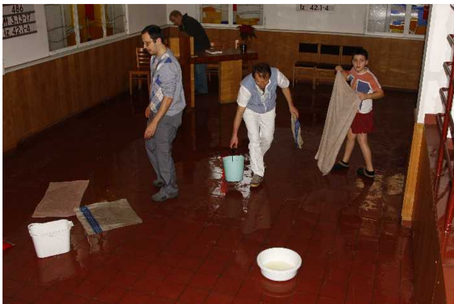
Momenty z povodní v Bubenči