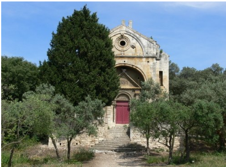
la Chapelle Saint-Gabriel