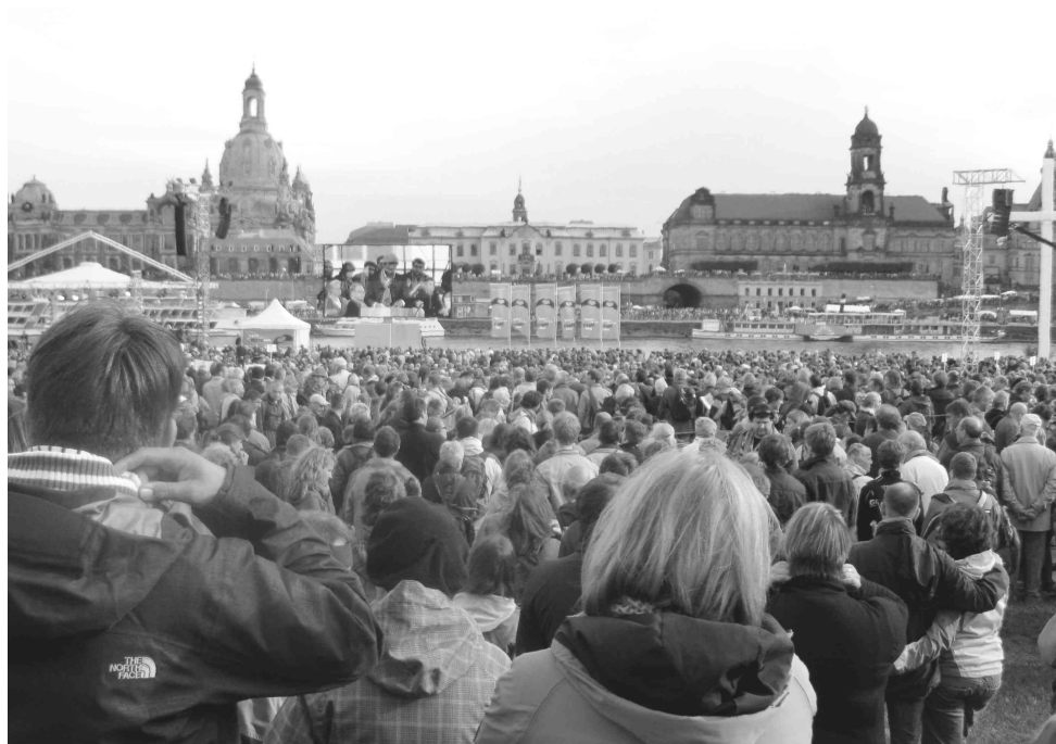
Kirchentag v Drážďanech