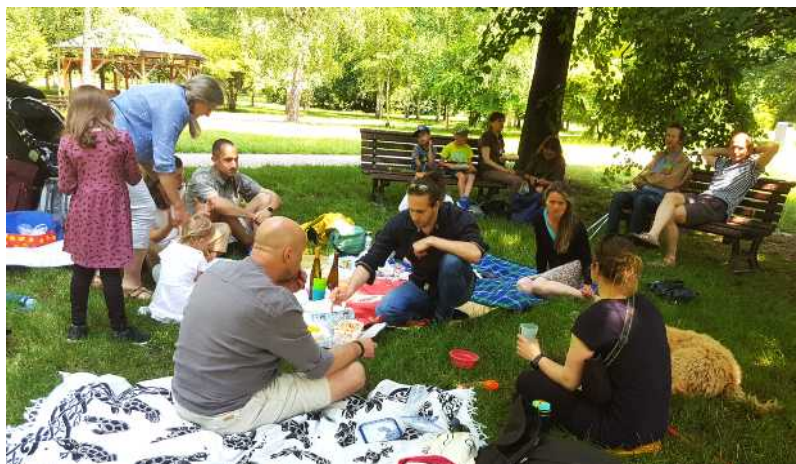
Ze sborového pikniku 18. 06. 2023

Tomáš Halík: Odpoledne křesťanství (Odvaha k proměně), nakladatelství NLN, s.r.o., 2021