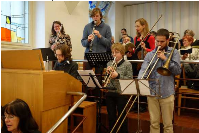
Vánoční kapela při bohoslužbách (2017-12-25)