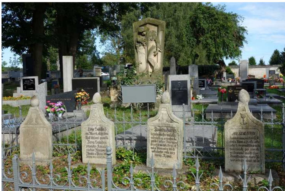
Z jiných sborů - hřbitov u evangelického kostela v Moravči (2017-08-20)

NEZAPOMEŇTE!!! 11. 3. 2018 Výroční sborové shromáždění