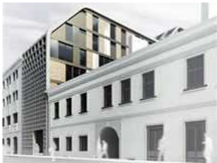
Zamýšlený plán developerů z roku 2011