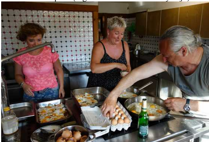
Alpy - Služba připravuje večeři (2017-07-07)