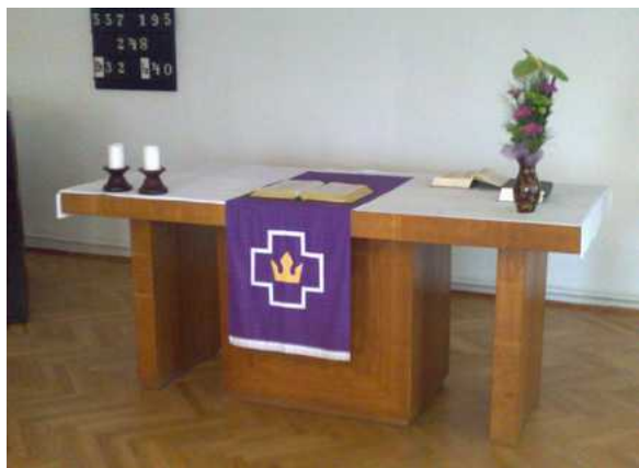
Ilustrace 2: Varnsdorf - postní parament

A jak je to s barvami? V našem prostředí se ustálila praxe čtyř hlavních liturgických barev. Bílá barva je pro hlavní svátky (Velikonoce, Vánoce), červená pro letnice (kromě toho někdy podle té které církve nejdůležitější neděle či naopak třeba svátek reformace), fialová pro postní doby (advent a postní doba před Velikonoce) a nakonec barva zelená pro ostatní neděle (tzv. mezidobí). Můžeme se setkat i s liturgickou barvou růžovou či černou, v církvích pravoslavných i mnoha dalšími.