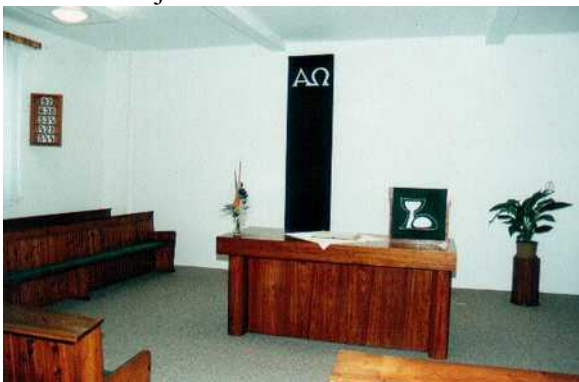
Ilustrace 1: zelené paramenty ve sboru v Jilemnici

Možná se nám vybaví adventní věnec a hlavně vánoční strom. Někdo má v té době zvláštní výzdobu i doma. Ale zbytek roku se často promění v řadu nedělí uvedených třeba jako pátá po sv. Trojici či druhá postní. Kázání se někdy na určité období zaměří, někdy pak už vůbec ne. Průběh církevního roku určitě není stěžejní