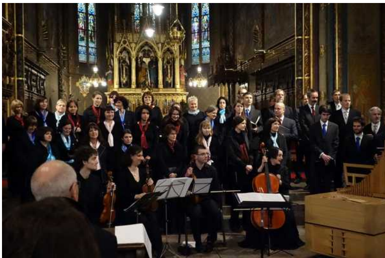
Velikonoční koncert NP na Vyšehradě (2017-04-05)