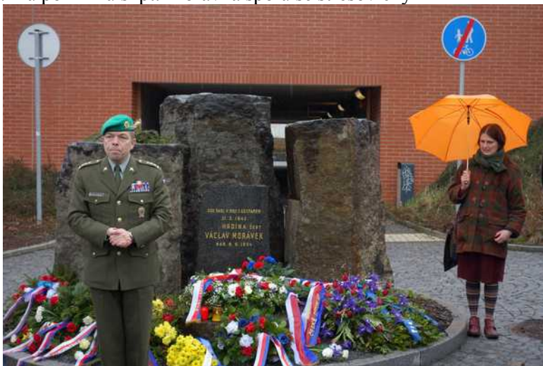
Každoroční setkání u pomníčku hrdiny št. kapitána V. Morávka (2017-03-19)