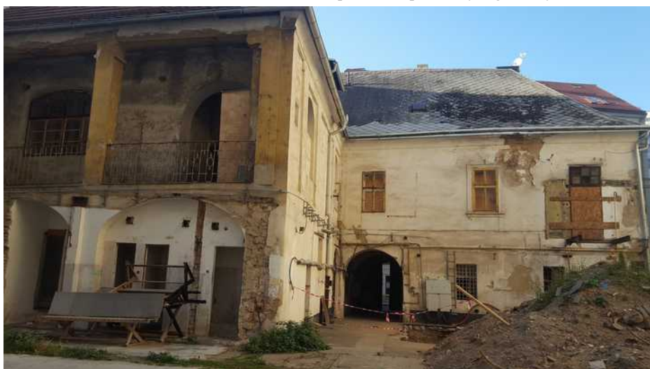
Současný stav 2018, pohled ze dvora