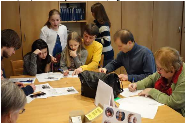
Maraton psaní dopisů (2017-12-17)