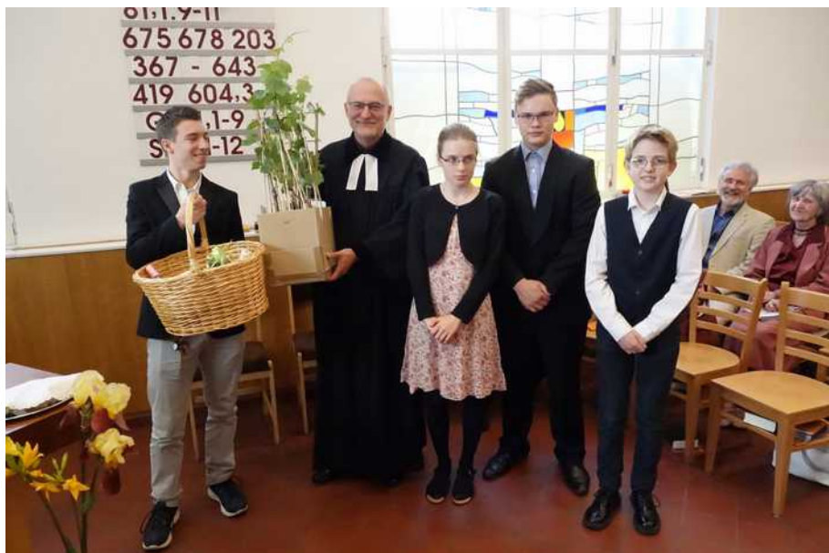
20. 5. 2018 Konfirmace